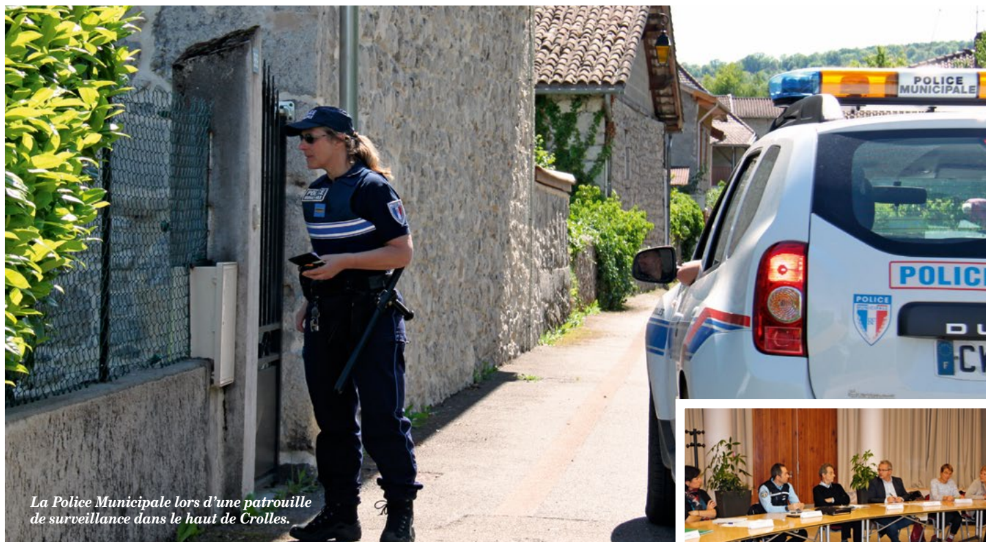
La Police Municipale lors d'une patrouille de surveillance dans le haut de Crolles.

Le Conseil Local de Sécurité et de Prévention de la Délinquance (CLSPD) s'est réuni en séance plénière au mois de décembre dernier. L'occasion pour les différents acteurs concernés d'échanger sur les chiffres et tendances enregistrés ces derniers mois.